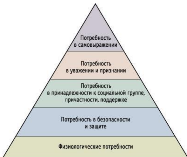
Рис. 1. Пирамида А. Маслоу